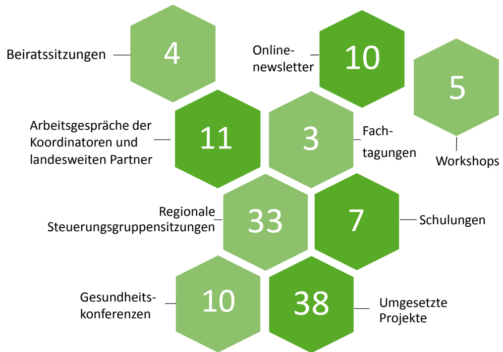
Abb. 5 Darstellung der Projektaktivitäten