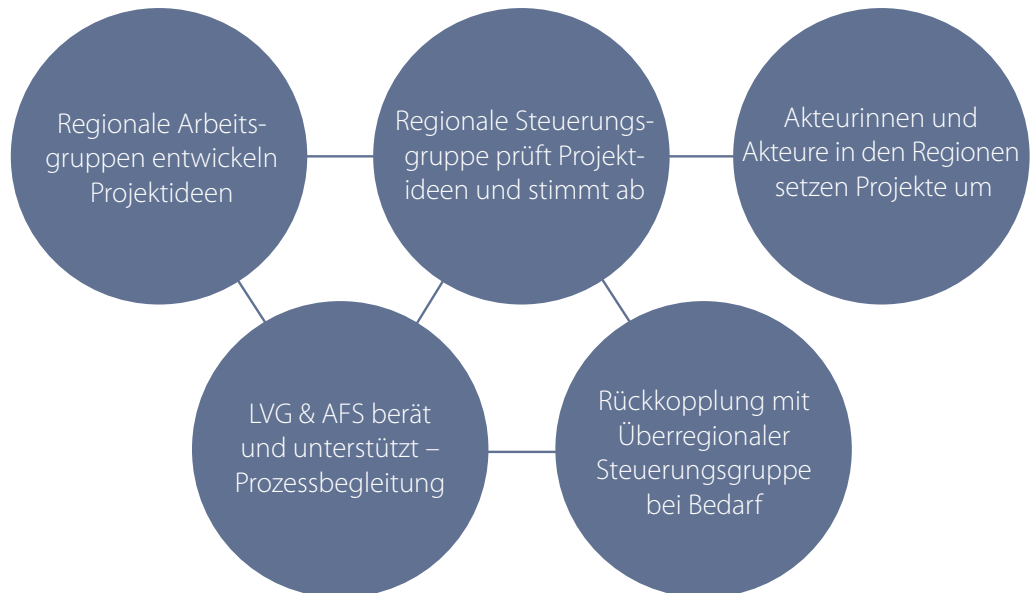
Abb. 2 Prozessabläufe in den Zukunftsregionen Gesundheit